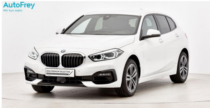
AutoFrey- Salzburg - www.autofrey.at