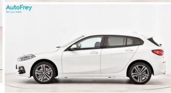
AutoFrey- Salzburg - www.autofrey.at