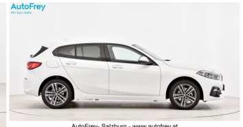
AutoFrey- Salzburg - www.autofrey.at