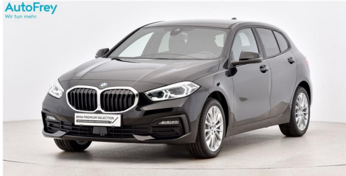
AutoFrey - Hallwang - www.autofrey.at