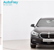
AutoFrey - Hallwang - www.autofrey.at