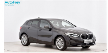
AutoFrey - Hallwang - www.autofrey.at