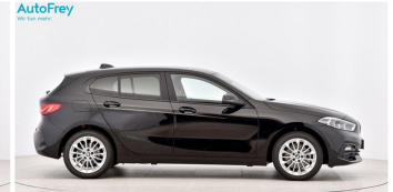
AutoFrey - Hallwang - www.autofrey.at