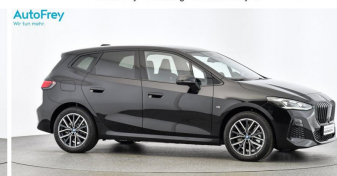
AutoFrey - Hallwang - www.autofrey.at