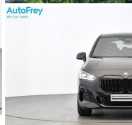
AutoFrey - Hallwang - www.autofrey.at