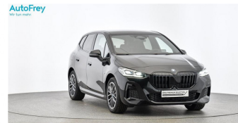
AutoFrey - Hallwang - www.autofrey.at