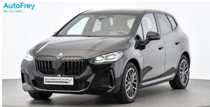
AutoFrey - Hallwang - www.autofrey.at