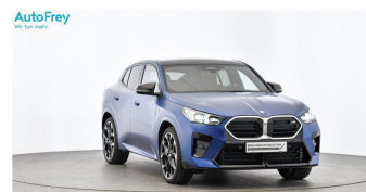
AutoFrey - Hallwang - www.autofrey.at