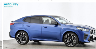
AutoFrey - Hallwang - www.autofrey.at