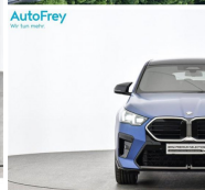
AutoFrey - Hallwang - www.autofrey.at