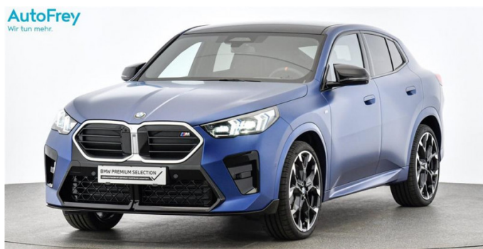
AutoFrey - Hallwang - www.autofrey.at